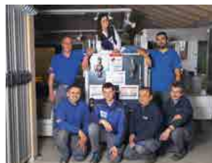
Kundendienst und Wartung