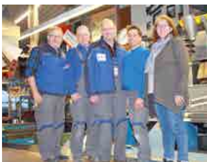
Dach und Wand