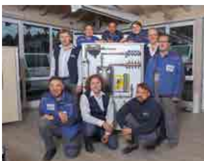
Heizung und Solar