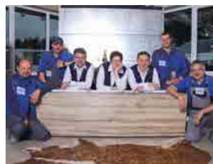
Bad komplett und Sanitär