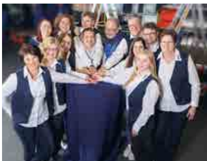
Büro und Verwaltung